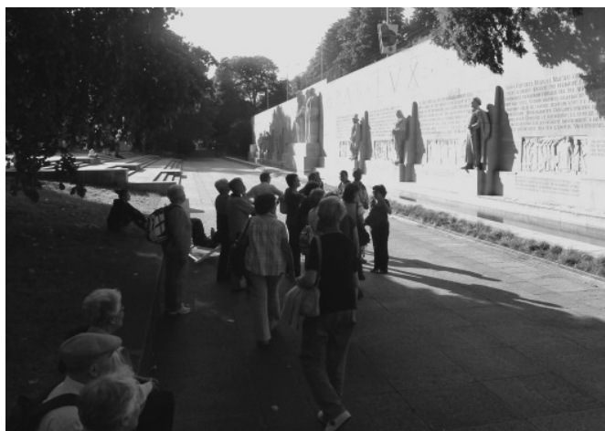
Ginevra: il gruppo davanti al Muro dei Riformatori