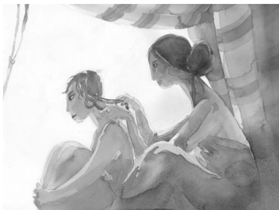
Disegno di Silvia Gastaldi

Siamo molto grati per tutte queste collaborazioni, attraverso le quali siamo in grado di fungere davvero da "finestra" sul mondo protestante, e non solo, italiano ed estero.