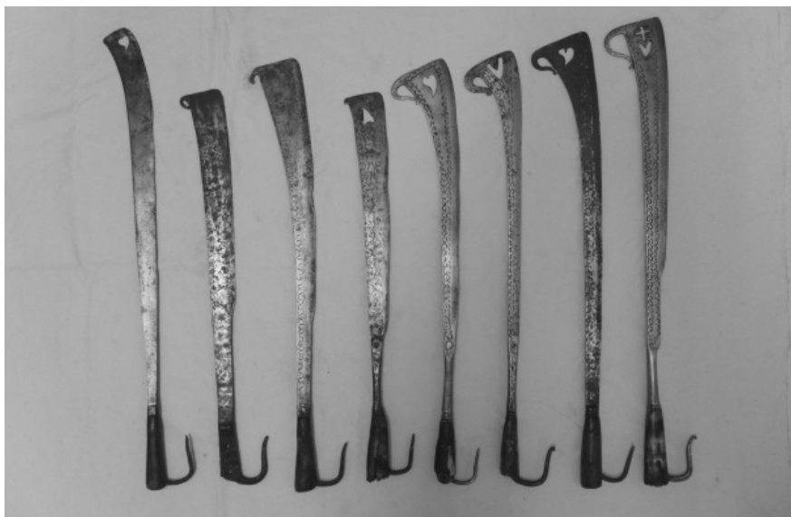
La collezione di beidane del Museo valdese

Nel 2015 il lavoro di ricerca sulla collezione di armi verrà utilizzato per predisporre una mostra, prevista per l'estate negli spazi del Centro Culturale Valdese a Torre Pellice , in cui saranno esposti i pezzi più interessanti e dove sarà possibile per i visitatori trovare molte delle informazioni raccolte durante il lavoro di catalogazione.