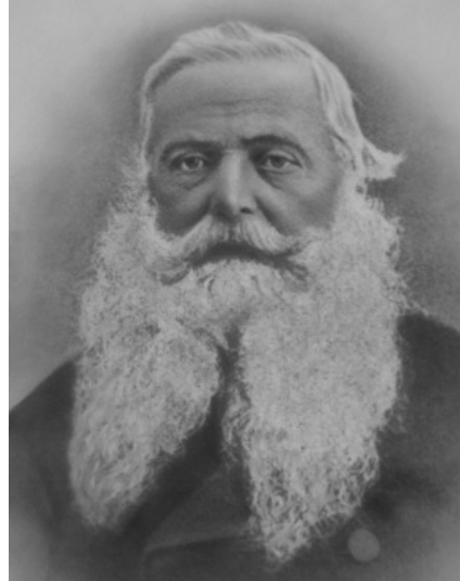
Ritratto di Piero Guicciardini

Personalità di rilievo nella Toscana risorgimentale, collezionista e bibliofilo, uomo di fede evangelica e cultura europea, partecipò alla vita culturale, sociale e politica della città di Firenze. Associato all' Antologia e al Gabinetto-scientifico-letterario di Gian Pietro Vieusseux, fu tra i