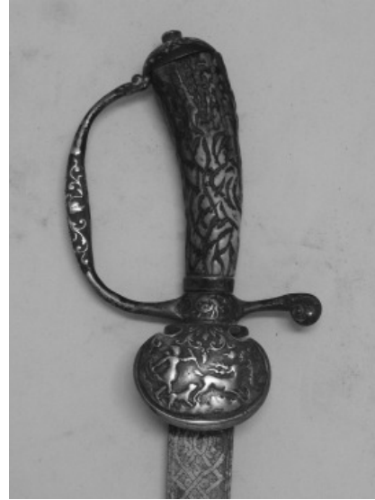
Particolare di una delle spade

del Museo la collezione di armi, grazie a continue donazioni (che continuano ancora oggi) , si è ulteriormente accresciuta sino agli attuali duecento pezzi . L'insieme degli oggetti è giunto così a coprire un arco cronologico che va dalle guerre di religione dell'età moderna sino alle due guerre mondiali del XX secolo.